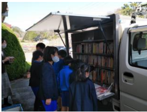
小童小学校の様子