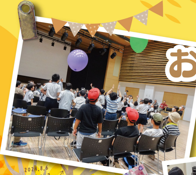
2024.8.6 おもしろ サイエンスショー @吉舎館