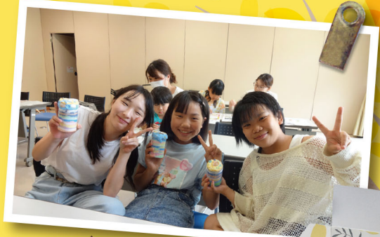
2024.7.20 ソルトサンドアートを つくろう @作木館