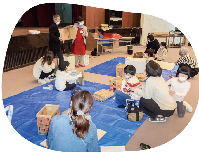
以前行った防災教室の様子

衛生的で水も火も最小限で温かい料理を提供できると、日本赤十字の災害派遣時にも使用されているそうだ。我が家では、普段の食事づくりでもアイラップを使い、蒸し鶏などを作っている。今後も災害が起きないことを祈りつつ、身近なことからできる、いざという時のための防災力を高めていこうと思っている。