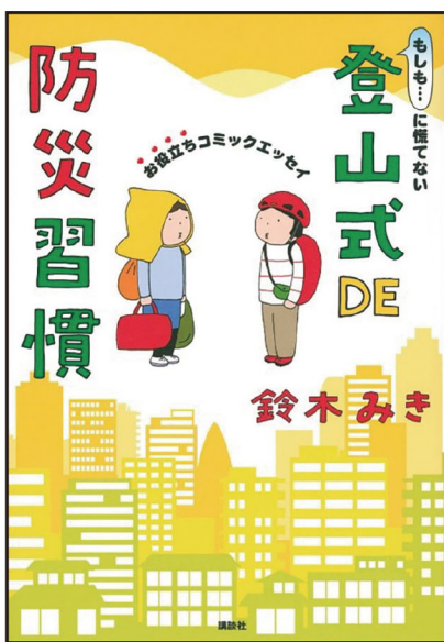
『登山式 DE 防災習慣』

3年前、『防災士』という資格を取った。防災士とは、地域防災の担い手を育成しようと設けられた民間の資格。なぜ司書が防災士?と思われるかもしれないが、頻繁に起きる災害への心得を学び、その知識がいつか図書館でも役立つかもしれないと思ったからだ。そして、消防士だった父の影響も大きい。図書館では、防災に関するさまざまな本を所蔵している。