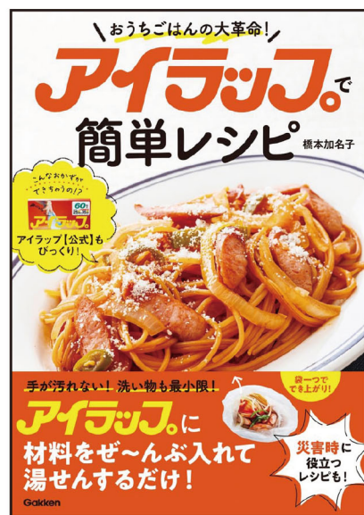
『アイラップで簡単レシピ』

その中で、オススメは『アイラップ』というビニール袋。熱に強く、食材を湯煎するだけでご飯も炊けるすぐれものだ。