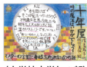
〈小学校・中学年の部〉