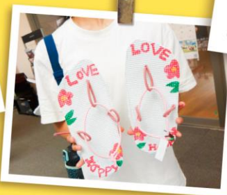
2023.8.25 こども教室 ビーチサンダルづくり @若田図書館