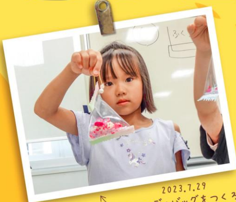
2023.7.29 キャンディバッグをつくろう @三和図書館