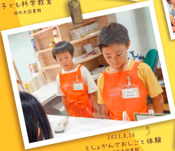
2023.8.26 としよかんでおしごと体験 @吉命図書館