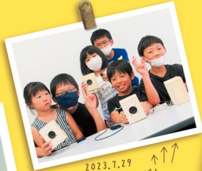
2023.7.29 親子でチャレンジ! 小型スピーカーを作ろう! @中央図書館