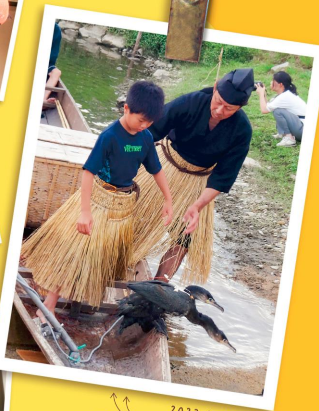
2023.6.24 鴨匠・船頭体験 @中央図書館