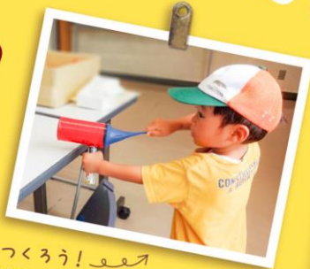
2023.8.11 空気砲をつくろう! @三良坂図書館