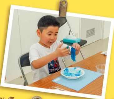
2023.8.4 MISTEE 子ども科学教室 @作木図書館